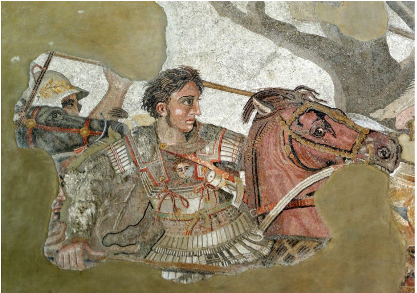
Alexander der Große in der Schlacht, Ausschnitt aus dem Mosaik im Haus des Fauns in Pompeji. Mit im Bild sein legendäres Pferd Bukephalos.