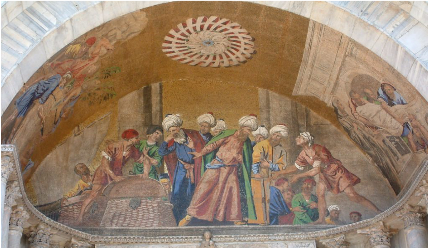
Ein Moasik an der Fassade von San Marco, das die List der Venezianer beim Transport des Heiligen Markus zeigt.

Im Zuge des Aufstiegs zur Großmacht baute Venedig die Markuslegende immer weiter aus, und über den Gebeinen wurde der bis heute weltbekannte Markusdom errichtet. Wessen Leichnam dort liegt, ist natürlich reine Spekulation. Sicher ist lediglich, dass zwei Venezianer im Jahr 828 irgendwelche sterblichen Überreste nach Venedig mitbrachten und die Zeitgenossen ihnen den Besitz der Markusreliquie relativ unstrittig zuerkannten – seither nennt sich Venedig auch Republicca di San Marco , Markusrepublik. Dass sich die Echtheit eines so alten Leichnams natürlich nicht wirklich bestätigen lässt, öffnet wiederum Tür und Tor für einige schräge Theorien.