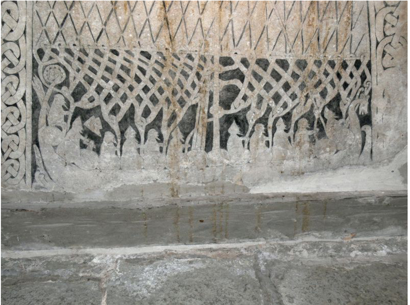
Ein Bildstein mit Wikingerschiff im schwedischen Museum Gotlands Fornsal in Visby. (Bildquelle 3 )

Noch später, 988, fuhr eine Wikingerflotte bis zum Bosphorus, dieses Mal allerdings in offizieller Mission. Die Skandinavier, die als Rus genannte Fürsten von Kiew über ein Gebiet im heutigen Russland herrschten, unterhielten schon lange Handelsbeziehungen zu den Byzantinern (Byzanz war das Oströmische Reich) in Konstantinopel. 4 Schließlich bat Kaiser Basileios II., der sich ständig mit Bürgerkriegen auseinandersetzen musste, Wladimir I. um Beistand. Den bekam er auch (er verschwägerte sich zum Dank mit dem Fürsten von Kiew, der sein Reich zum Christentum konvertieren ließ), und zwar mit langanhaltendem Erfolg für die beteiligten Wikinger. Die besten Kämpfer der Skandinavier stellten bis zur ersten Eroberung durch die Kreuzfahrer im Jahr 1204 die Leibgarde des Kaisers und wurden Warägergarde genannt. 5 Dass Alrik und seine Männer im Roman also ordentlich herumgekommen sind, ist keineswegs völlig erfunden, der historische Rahmen wurde lediglich um einige Jahrzehnte nach hinten verlegt.